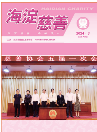
北京市海淀区慈善协会 主办