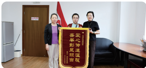
2025年5月22日，受助患者家属给区慈善协会送来锦旗。