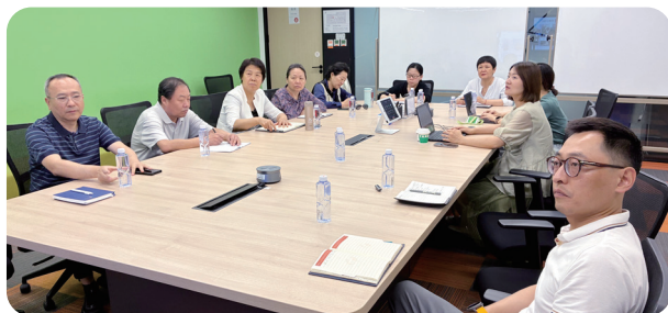
2025年6月10日，海淀区慈善协会到滴滴公益调研，就如何推动慈善募捐线上捐款工作进行交流。