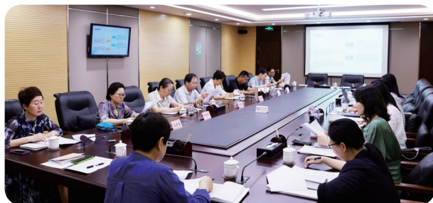
2025年6月12日，海淀区慈善协会和海淀区民政局共同讨论2025年中华慈善日系列活动方案。