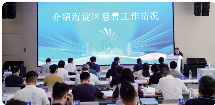
2025年6月23日，海淀区慈善协会在统战部会议上向“海联会”理事们做“春雨行动 首善有我”捐款活动动员。