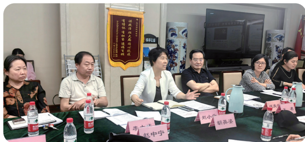
2025年6月6日，海淀区慈善协会领导到北京市慈善协会参加“药神计划”座谈会。