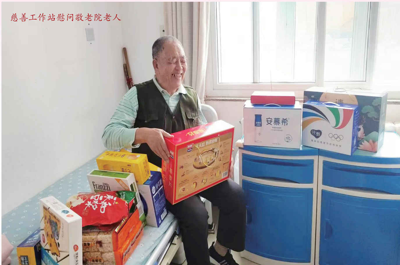
慈善工作站慰问敬老院老人

主 办：北京市海淀区慈善协会 地 址：北京市海淀区西四环北路11号 邮 编：100195 网 址：www.hdcishan.com.cn