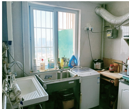
北下关街道慈善工作站